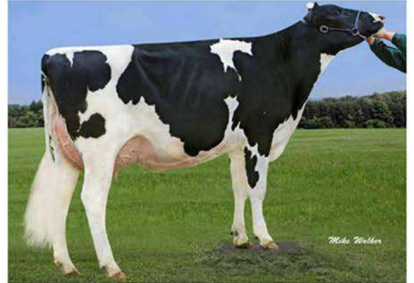
GREEN-BANKS CANDY ET

PEAK ALTAAMULET ET X GREEN-BANKS CANDY ET (MONTEREY) X SCO-LO-KRUSE CANDY ET EX90 (DEAN) X LARCREST CORALEE ET GP83 (GERARD)