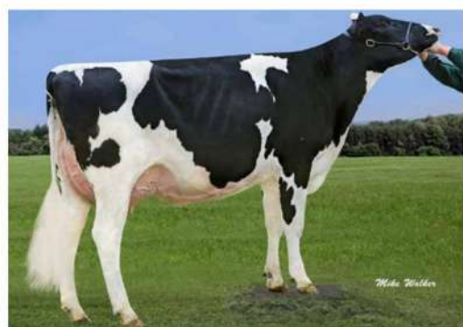
GREEN-BANKS CANDY ET