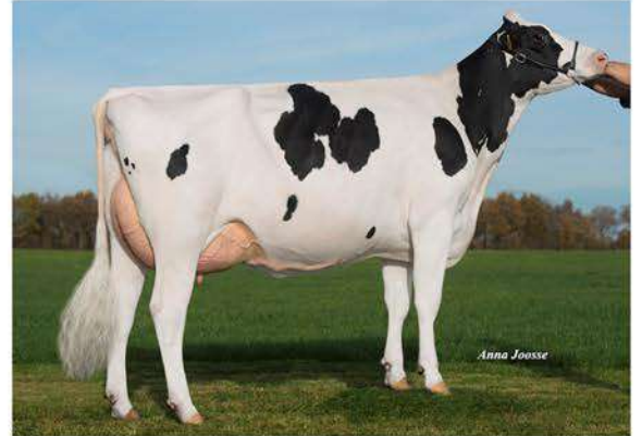
DG CANDIDE 8604 ET

S-S-I MONTROSS JEDI ET X CANDIDE 8604 ET (POWERBALL P) X DG CANDIDE ET (MOGUL) X LARCREST CALE ET VG89 EXMS (OBSERVER) X LARCREST CRIMSON ET EX94 96MS (RAMOS)