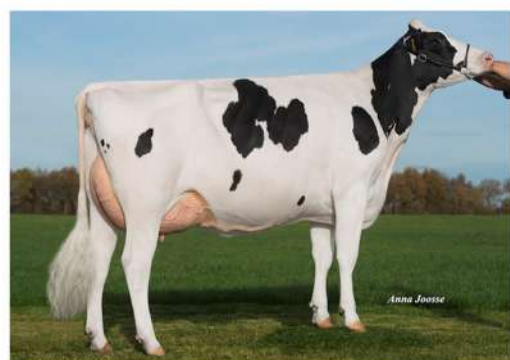
DG CANDIDE ET