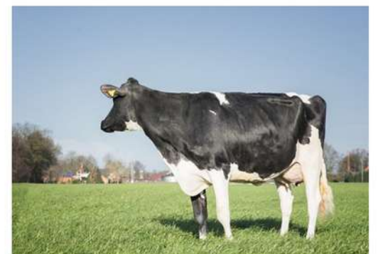
WILDER HIRA VG85